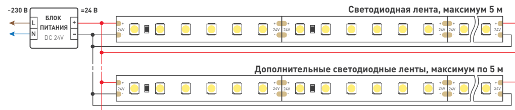
Схема 2. Подключение нескольких светодиодных лент с двух сторон. Рекомендуется использовать для обеспечения равномерного свечения ленты по всей длине