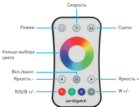
Рисунок 2. Назначение кнопок на пульте управления